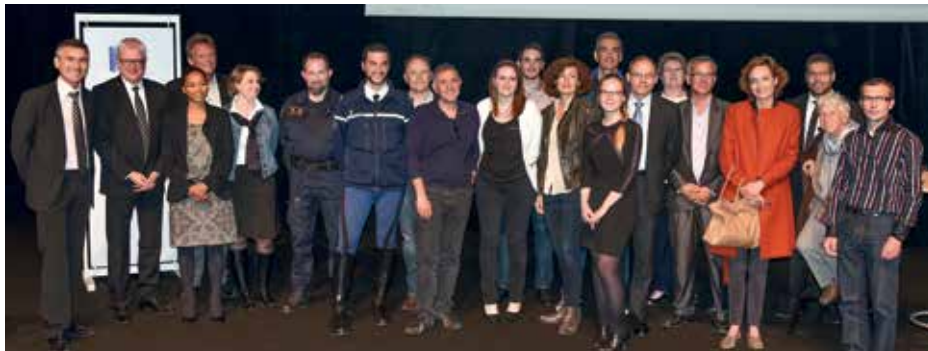
▲ Avec l'ACEF, une rencontre entre les moyens apportés par vos cotisations et les projets d'associations d'agents du service public, en partenariat avec la Banque Populaire Rives de Paris.

Faites connaissance avec les 17 associations de fonctionnaires qui sont entrées dans le cercle des partenaires de l'ACEF Rives de Paris, bénéficiant d'un soutien financier pour leurs initiatives et projets. Trois d'entre elles étaient présentes lors de l'Assemblée générale pour expliquer leurs actions et leurs projets. Trois associations, trois coups de cœur.