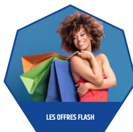
LES OFFRES FLASH