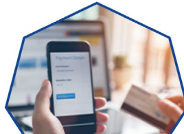
LES OFFRES MULTI-AVANTAGES MEYCLUB