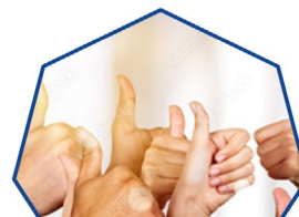
LES OFFRES NATIONALES ACEF