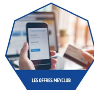
LES OFFRES MEYCLUB