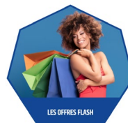
LES OFFRES FLASH